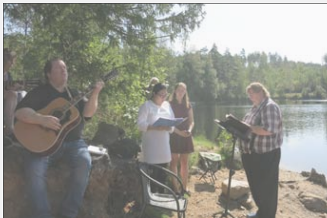
En underbar stund med sång och bön.

En fin dag att minnas, med det gemensamma evighetsperspektivet som bärande vision! ■