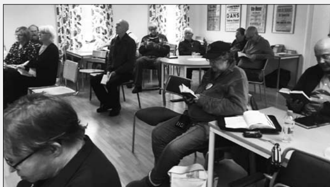
Ett flertal vänner från grannskapet deltog i möten på Träffpunkten i Skagersvik under Allhelgonahelgen.